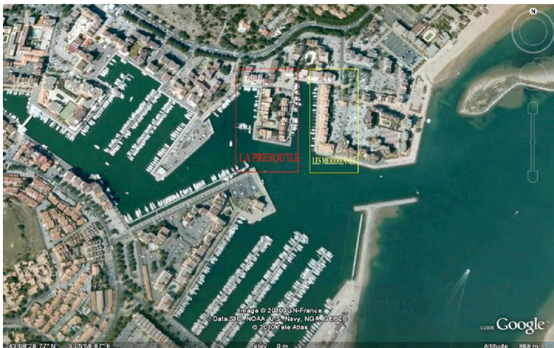
Port de Gruissan

L'aménagement du port n'a constitué que deux ensembles distincts de marinas dont les acquéreurs sont regroupés au sein de deux copropriétés, la « Presqu'île » et la « Méridienne » pour un nombre total d'appontements relativement modeste (99), qui représente un faible pourcentage d'un potentiel portuaire de 1 330 postes auxquels s'ajoutent 250 places sur terre-plein.