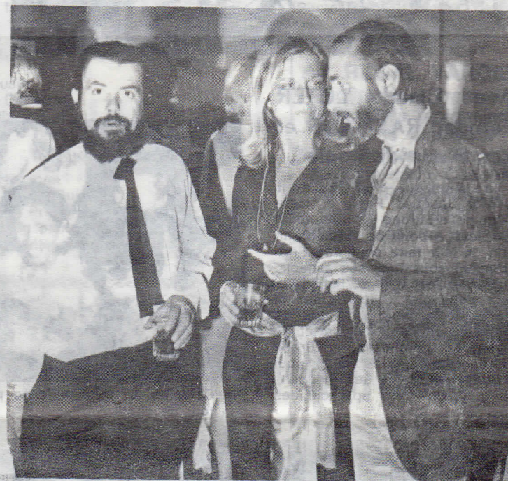
Trois des quatre artistes qui exposent à l'Atelier.

LOCATIONS - GERANCES - VENTES Place des 6 Canons PORT-GRIMAUD Tél: 43.82.85