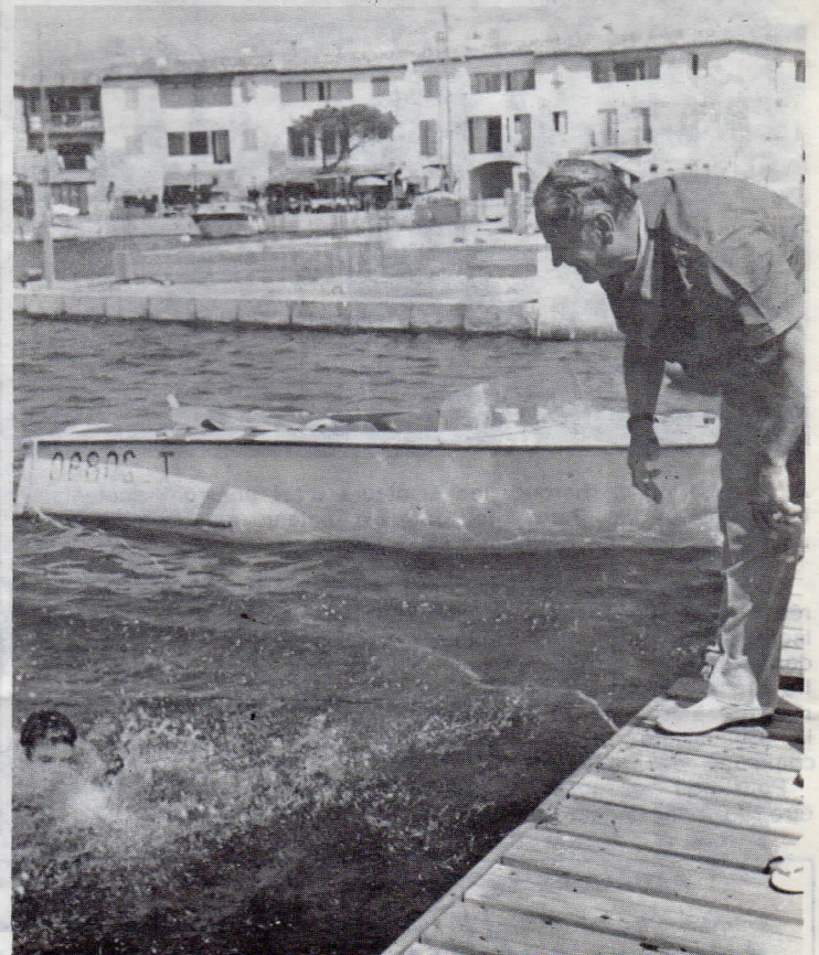
Henri Charrière, l'auteur à succès de « Papillon », tiré déjà à 400.000 exemplaires, avant d'aller signer quelques exemplaires de son ouvrage à la Maison Commune, a bien voulu, devant ses nombreux admirateurs, initier de jeunes nageuses à la brasse papillon.

VOTRE DÉMÉNAGEUR DE 100 ANS D'EXPÉRIENCE ET DE QUALITÉ EST A VOTRE DISPOSITION