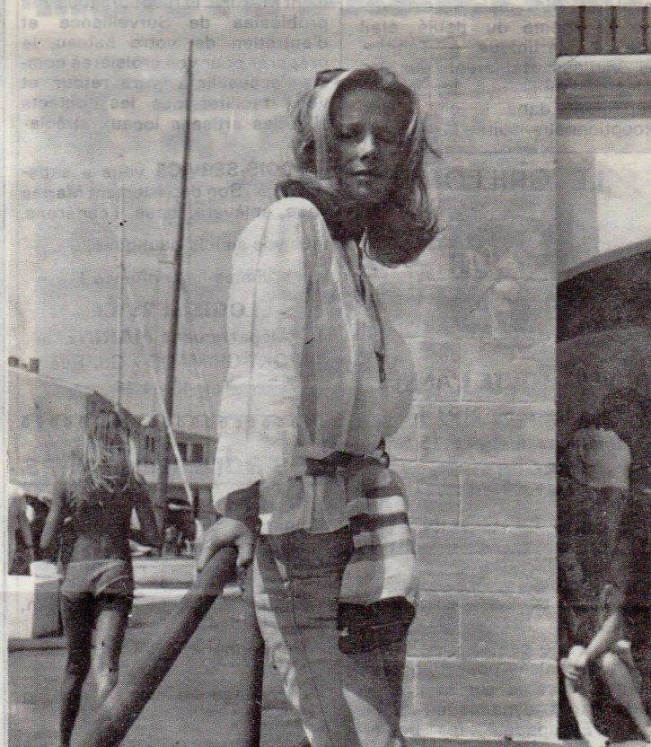
Venant de Valbonne où elle passe ses vacances, la belle héroïne du dernier film d'André Cayatte « les Chemins de Katmandou », a fait une apparition — blonde et bronzée — à Port-Grimaud.