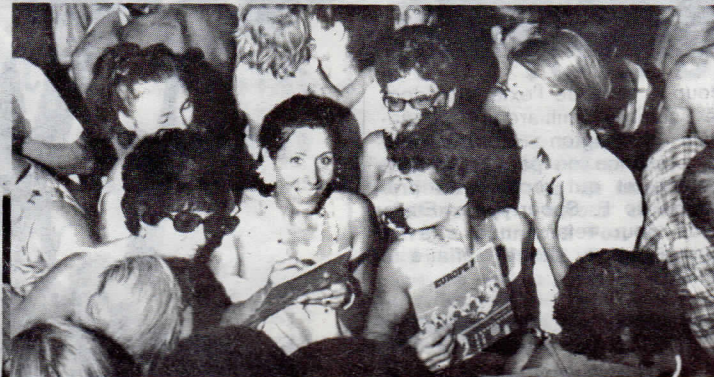
Pia Colombo fut très sollicitée par ses admirateurs, à l'issue de son tour de chant...

Parmi les invités l'on pouvait remarquer Claude Luter et Fernand Raynaud accompagnés de leurs épouses, le quartet de Lyon et l'orchestre d'Europe N° 1 « Les Pieds de Poule » qui exécutèrent dans les haubans un pot-pourri très apprécié des invités.