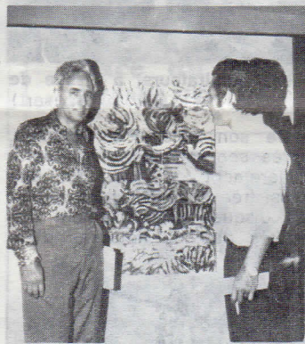
L'Artiste en discussion avec le non moins célèbre milliardaire

coup e gens de l'extérieur, dont le célèbre milliardaire américain Huntington Hartford dont la présence ne passa pas inaperçue et qui réclama la présence de F. Spoerry aux Etats-Unis pour refaire une cité lacustre... Une (actre) affaire à suivre !