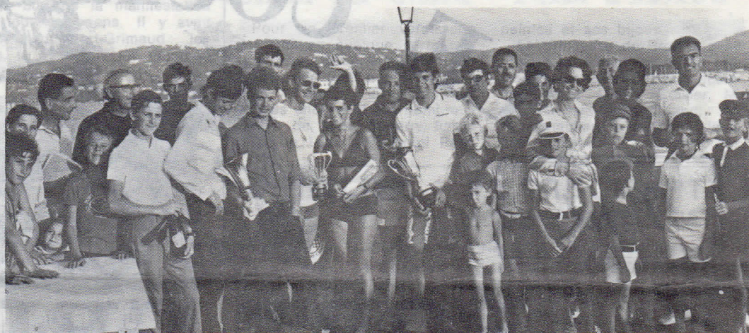
A l'issue de la proclamation des résultats et de la remise des coupes, les participants posent pour la traditionnelle photo de famille.

Durant toute la journée du 17 août s'est déroulée la régata organisée par le Club de la Mer, pour la Coupe François Spoerry.